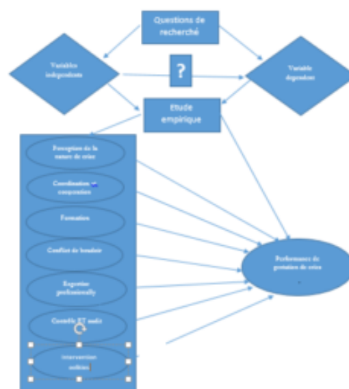
Figure 2 : Le modèle conceptuel de la recherche ou MCR

descriptive, qui est définie comme « une méthode qui repose sur la collecte d'informations et de données sur un phénomène, un événement, une chose ou la réalité », afin d'identifier le phénomène